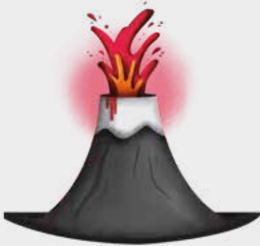
ERUPCIÓN DE UN VOLCÁN

Si vives en departamento, considera también en esta evaluación las condiciones del edificio, como por ejemplo, iluminación de pasillos y escaleras, ductos de ventilación, escaleras de emergencia, ascensores, áreas comunes, entre otras.