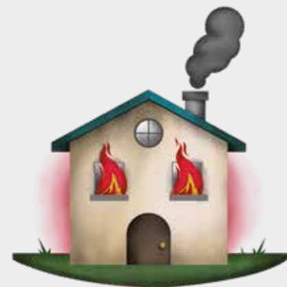
INCENDIO EN CASA