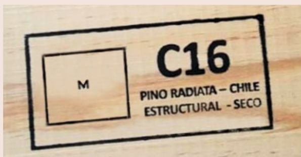
Ejemplo de rótulo con timbre