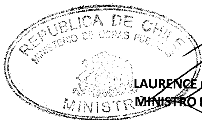
LAURENCE GOLBORNE RIVEROS MINISTRO DE OBRAS PÚBLICAS